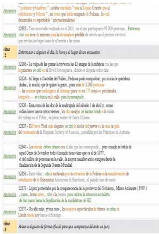
Figura 3: Resultados de la búsqueda

frecuencia de cada esquema y sobre las frases asociadas a cada uno de ellos.