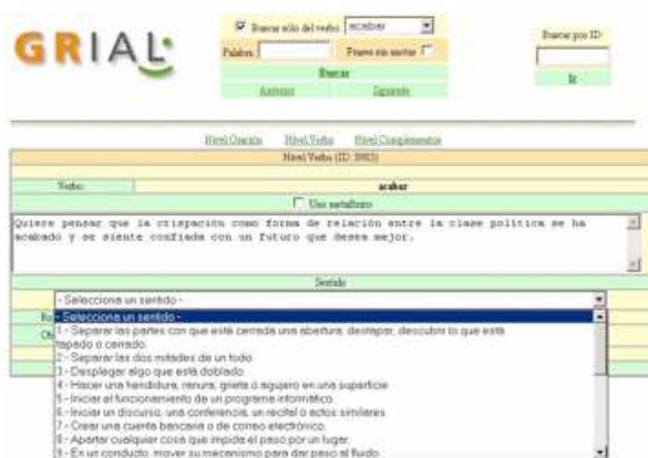
Figura 1: Anotación del sentido verbal

El inventario de sentidos, como se ha mencionado, es anterior al proceso de anotación, pero es modificado siempre que los ejemplos encontrados en el corpus demuestren la existencia de un sentido no contemplado, o bien, cuando los ejemplos son difíciles de clasificar porque se da confusión entre sentidos, lo que provoca que algunos de ellos acaben fusionándose. Además, si en alguna frase el sentido verbal se utiliza metafóricamente y este uso no se considera suficientemente habitual como para crear un nuevo sentido, se marca como uso metafórico del sentido inicial.